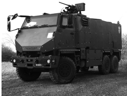
Le véhicule de détection NBC

grettable, d'autant plus qu'il n'est pas nécessaire de posséder des connaissances spécifiques.