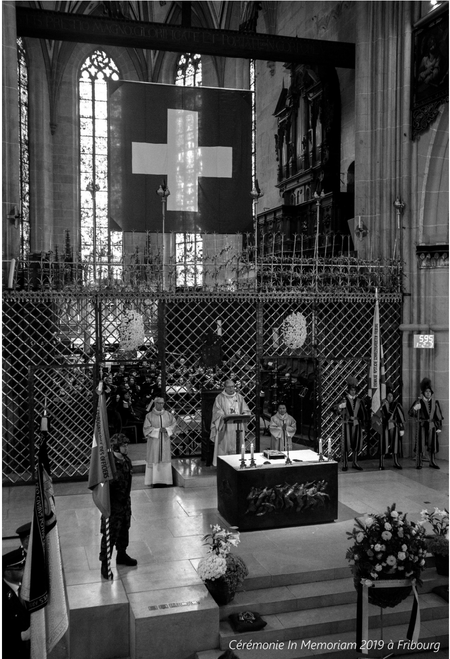
Cérémonie In Memoriam 2019 à Fribourg