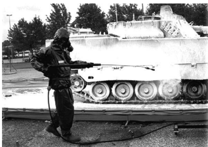
Décontamination de personnes et de véhicules durant un exercice NBC

Quelles sont les caractéristiques du véhicule de détection NBC ? Comment est-il engagé ?